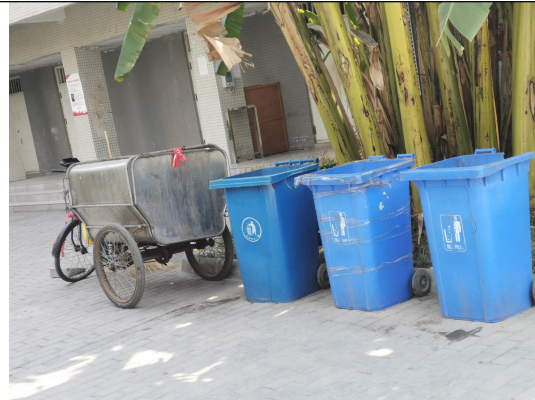
公寓外垃圾收集点